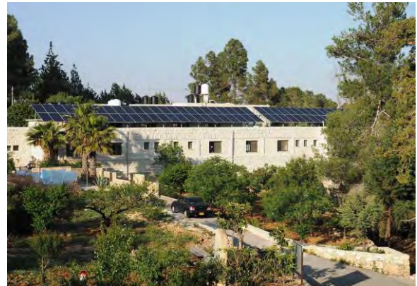
Neue Solaranlage auf der Sternberg-Förderschule

Wir bitten für die Zusammenarbeit der Missionsorganisationen der Brüdergemeine in Dänemark, Deutschland, Großbritannien, den Niederlanden, Schweden, der Schweiz und in Nordamerika.