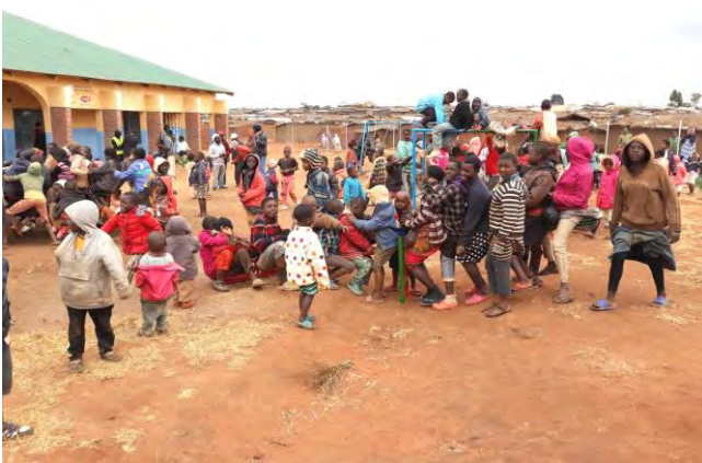
Child Care Center im »Dzaleka Refugee Camp« in Malawi

Wir danken für den unverzichtbaren Dienst, den die kleinen Krankenhäuser der Brüdergemeine in Isoko und Mbozi, beide in Tansania, vor allem für die Menschen im ländlichen Raum tun.