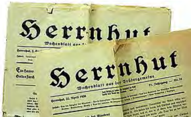
Ein Archiv-Projekt 2019: Entsäuerung von Dokumenten

Wir bitten für das Unitätsarchiv in Herrnhut, dessen Mitarbeitende mit geringen Mitteln eine wichtige Arbeit tun bei der Bewahrung und Erschließung kostbarer Zeugnisse aus der Geschichte der Unität.