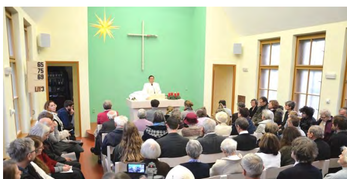
Einweihung der neuen Milič-Kapelle in Prag-Malešice

Wir danken für die Arbeit, die in der »Christian-David-Schule« bei Barkava in Lettland geschieht, insbesondere für die Ökumene, die an der Schule von Lernenden und Lehrenden gelebt wird.