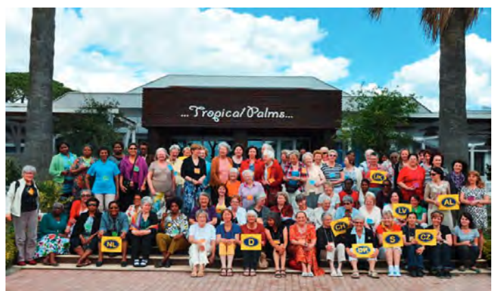
Europäische Schwesternkonferenz 2013 in Durres, Albanien

Wir bitten für die Umsetzung der Beschlüsse und Anregungen der Synode im Mai 2018 in Herrnhut, insbesondere für gute Ideen beim Verfolgen des »Strategieplans Brüdergemeine 2027«.