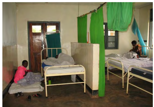
Überfüllte Station im »Isoko Hospital« in Tansania

Wir danken für die Erfolge, die die Brüdergemeine in Ost- und Südafrika in den letzten 15 Jahren beim Kampf gegen HIV/Aids und bei der entsprechenden Sensibilisierung der Menschen erzielt hat.