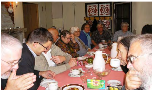
Estnisch-deutsche Begegnung in Tallinn

Wir danken für die Rolle, die die Brüdergemeine in Lettland beim Jubiläum »100 Jahre erste lettische Republik« im November 2018 spielen durfte, und für die Aufmerksamkeit, die sie dabei genoss.