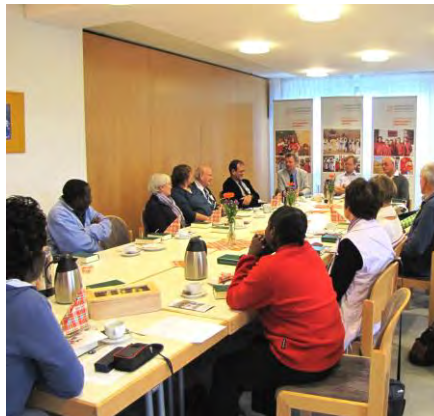
Partnerschaftsgruppe Ulm - Tukuyu (TZ)