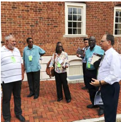
Tagung des Unitätsvorstandes

Wir danken für das Erscheinen des Handbuches »Our Moravian Treasures« (Unsere brüderischen Schätze), das für die theologische Ausbildung in der weltweiten Brüder-Unität bestimmt ist.