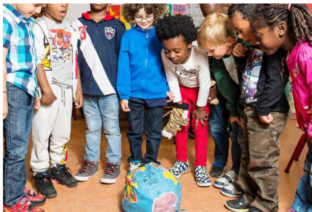
Kinder in der Grundschule »Crescendo« in Amsterdam