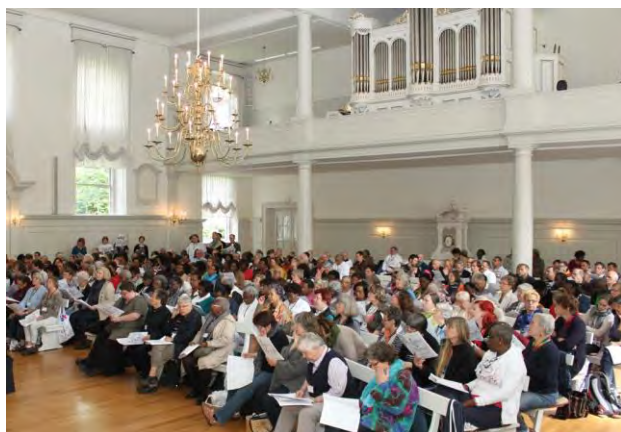
Der 250 Jahre alte Kirchensaal in Zeist

Wir danken für die gelungenen Jubiläumsfeierlichkeiten »250 Jahre Kirchensaal in Zeist« im Jahre 2018, für vielfältige Begegnungen und historische Erinnerungen in diesem Zusammenhang.