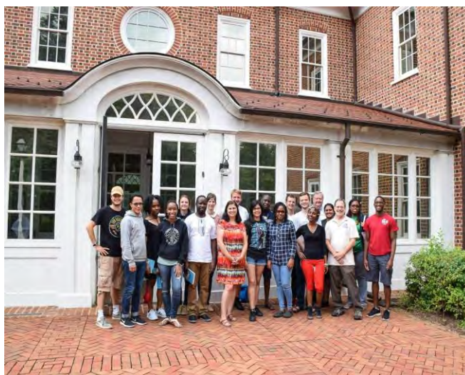
Während der »Unity Youth Heritage Tour« 2018

Wir danken für die »Unity Youth Heritage Tour« (Herrnhuter Jugend-Erbe-Tour), die im August 2018 mit 22 Jugendlichen aus vielen Provinzen durch die USA führte und Gemeinschaft und Einheit stiftete.