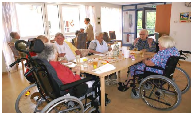
Im »Christoph-Blumhardt-Haus« in Königsfeld/Schw.

Wir bitten für den »38. Brüderischen Bläserntag« im Juni 2019 in Neuwied, dass er etwas ausrichte zum Lobe Gottes und zur Stärkung der Gemeinschaft zwischen Blasenden aus mehreren Ländern.