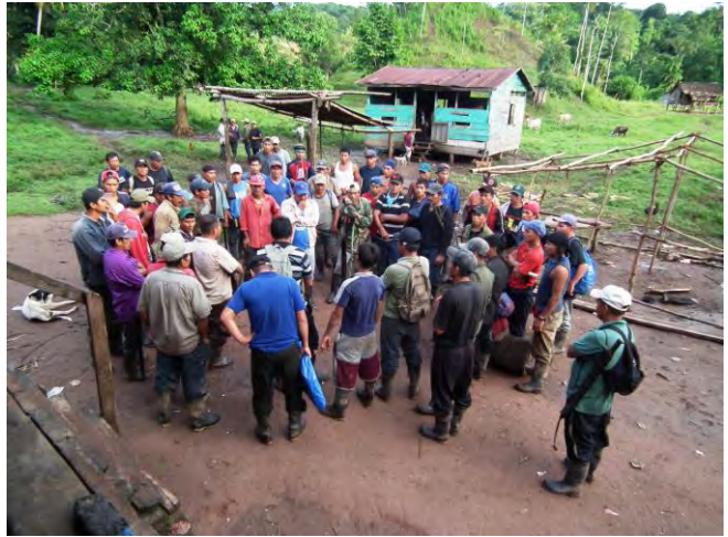
Dorfversammlung in Wilu, Nikaragua, nach Landraub

Wir bitten für die von politischen, ethnischen und sozialen Spannungen zerrissene Unitätsprovinz Nikaragua, insbesondere für diejenigen, die von Landraub und Entwurzelung bedroht sind.